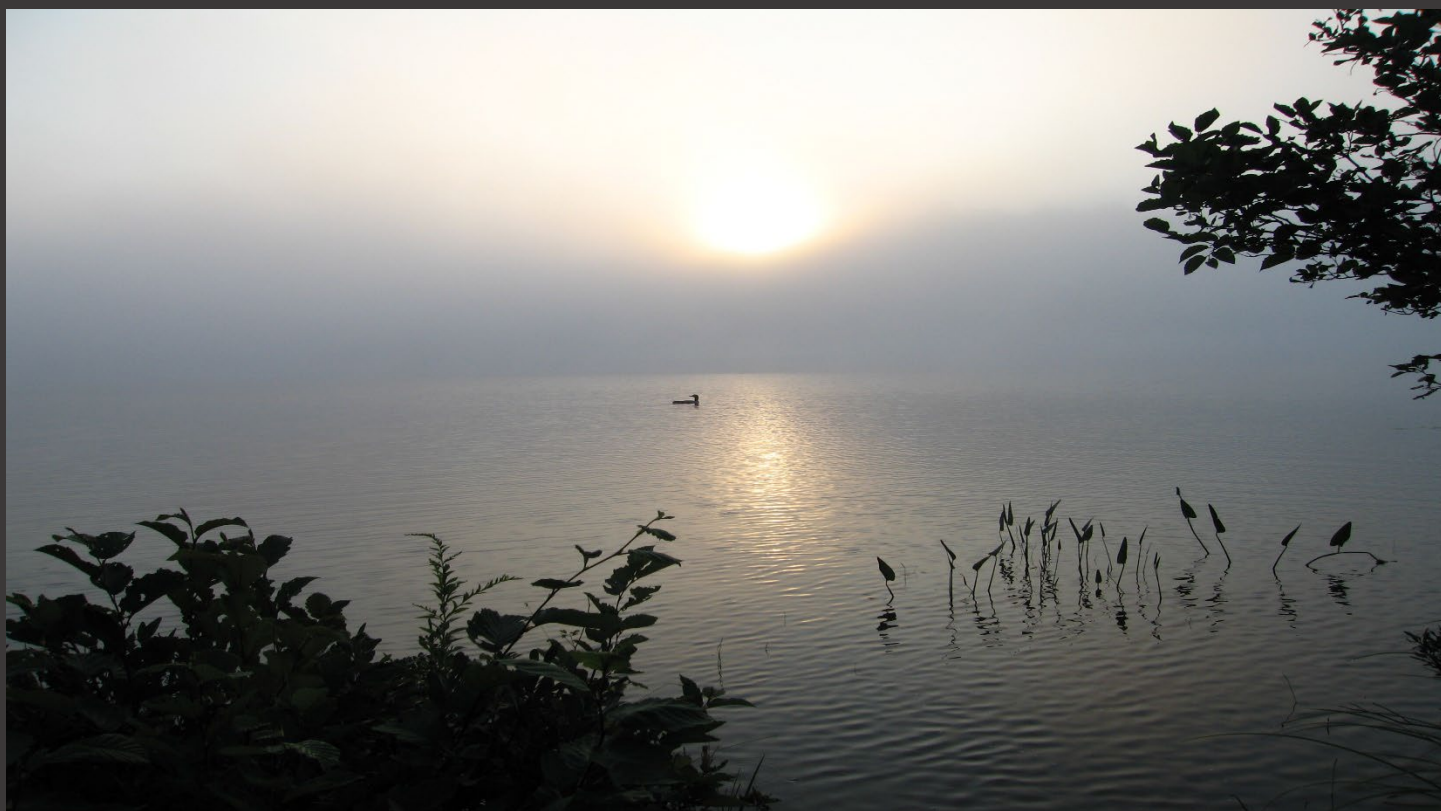
Manon Laroche, gagnante du troisième prix / Manon Laroche, winner of the third prize (Huard au printemps - Lac Carruthers / Spring Loon - Lake Carruthers)